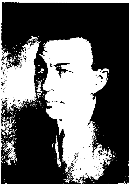
А. Ростовцев. Портрет С.Рахманинова

У Кристины давно установились хорошие контакты с советским посольством в Коста-Рике. От нее стало известно, что в городе Сан-Хосе бывают правнуки С.В.Рахманинова. На одной из неофициальных встреч в необычно прохладный для здешних экваториальных широт день состоялось знакомство