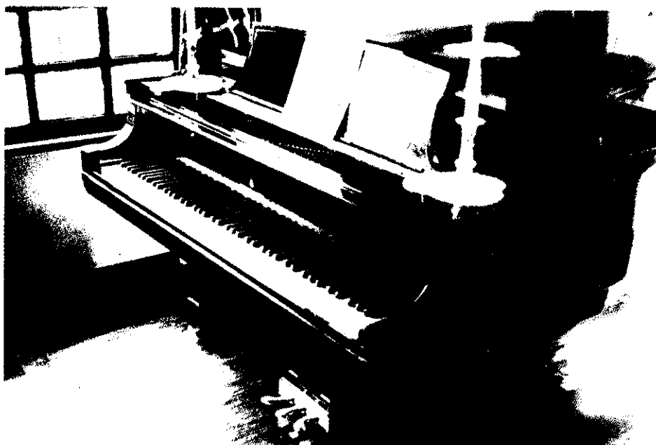
Последний рояль С.Рахманинова