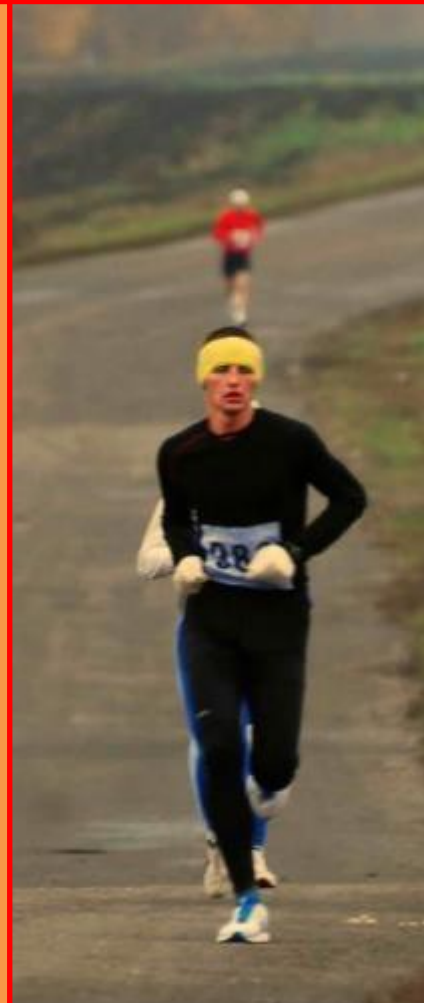
Лидер I марафона 42 км 195 м